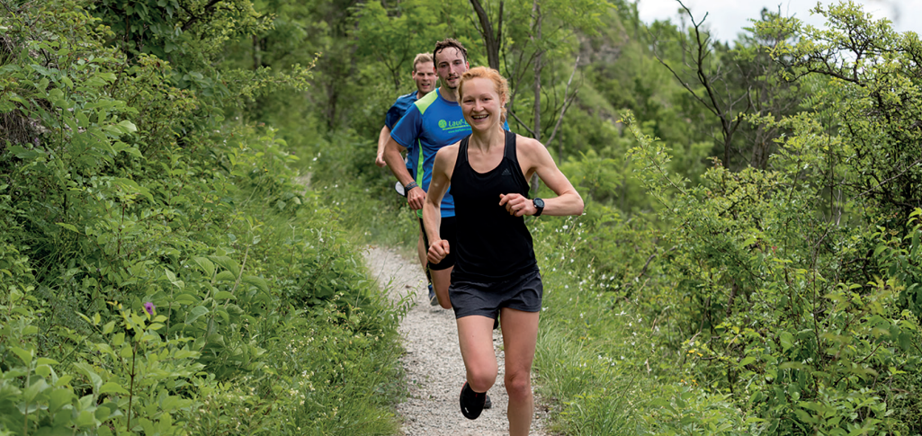
Trailrunning in den Kernbergen