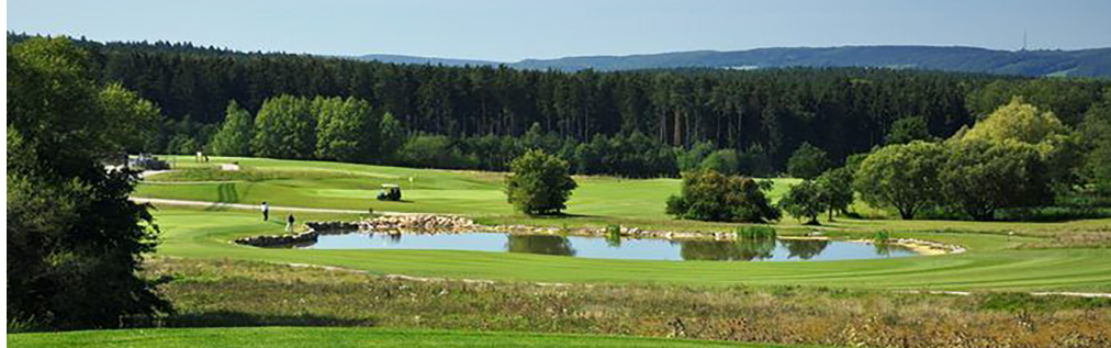
GolfResort Weimarer Land