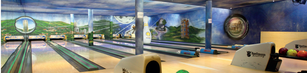
Bowlingbahn im Fair Resort

Rudolstädter Straße 93, 07745 Jena Tel.: 03641 6850 info@jembo.de www.jembo.de