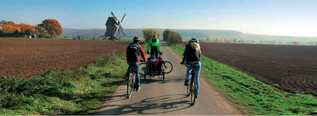
Bockwindmühle bei Krippendorf