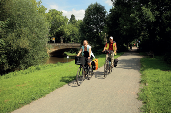
Gera-Radweg in Erfurt