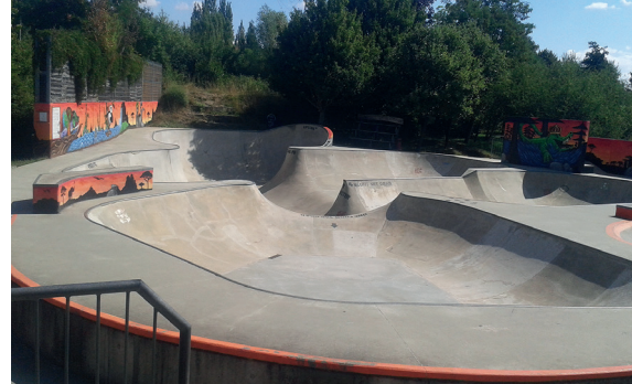
Skatepark Red Shelter

Stauffenbergstraße 20A, 99427 Weimar Tel.: (Jugendclub): 03643 420873 jc-nordlicht@t-online.de